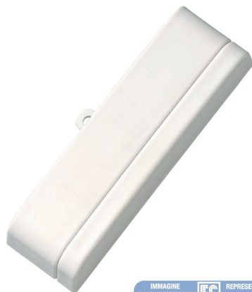
IMMAGINE RAPPRESENTATIVA EC REPRESENTATIVE IMAGE