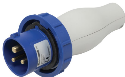
IMMAGINE RAPPRESENTATIVA EC REPRESENTATIVE IMAGE

Industriale > Prese-spine > Moltiplicatori e adattori > Adattori di sistema > Combinazione prese cee (iec 60309) > Da presa schuko a spina industriale - klect