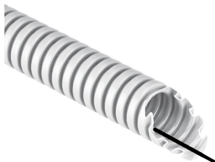
IMMAGINE RAPPRESENTATIVA EC REPRESENTATIVE IMAGE

Tubi e raccordi > Tubi > Tubi corrugati > Tc15 - pvc - 33212 - 750 n > Tubo in plastica per impianti elettrici > Bianco - con tirafilo