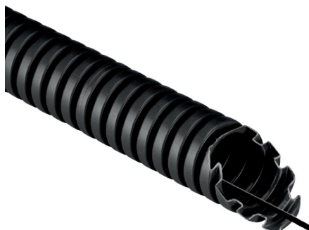
IMMAGINE RAPPRESENTATIVA EC REPRESENTATIVE IMAGE

Tubi e raccordi > Tubi > Tubi corrugati > Tc15 - pvc - 33212 - 750 n > Tubo in plastica per impianti elettrici > Nero - con tirafilo