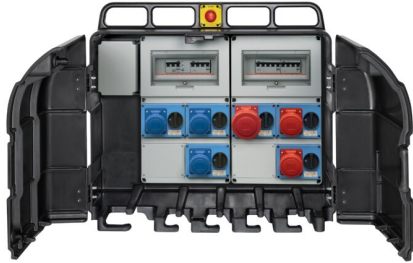
IMMAGINE RAPPRESENTATIVA REPRESENTATIVE IMAGE

Industriel > Tableaux de distribution > Tableaux de distribution > SÉrie asc 800 - coffret de chantier > Coffret de chantier > 6 prises horizontales verrouillÉes - alimentation avec bornier