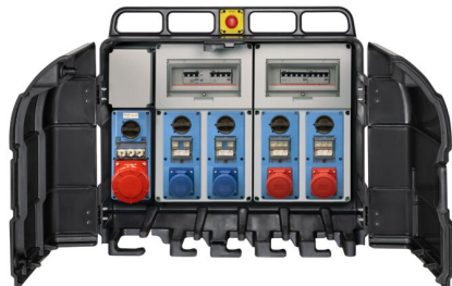
IMMAGINE RAPPRESENTATIVA REPRESENTATIVE IMAGE

Industriel > Tableaux de distribution > Tableaux de distribution > SÉrie asc 800 - coffret de chantier > Coffret de chantier > 5 prises verticales verrouillÉes - alimentation avec bornier