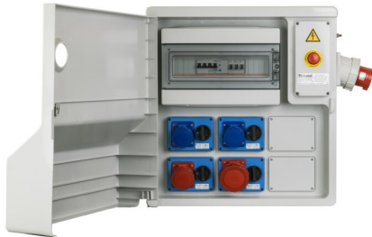
IMMAGINE RAPPRESENTATIVA REPRESENTATIVE IMAGE

Industriel > Tableaux de distribution > Tableaux de distribution > SÉrie asc 700 - coffret de chantier > Coffret équipée mobile > 4 prises horizontales verrouillable - alimentation avec prise