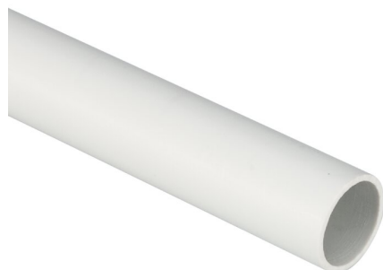
IMMAGINE RAPPRESENTATIVA EC REPRESENTATIVE IMAGE