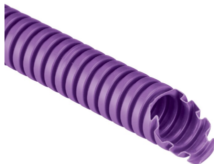
IMMAGINE RAPPRESENTATIVA EC REPRESENTATIVE IMAGE