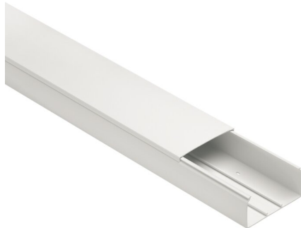
IMMAGINE RAPPRESENTATIVA REPRESENTATIVE IMAGE

Goulottes > Mur et plafond > Câbles > Cph - goulottes sans halogène > Goulotte d'installation