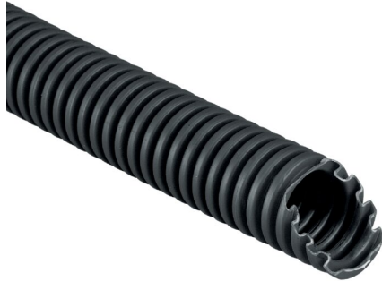
IMMAGINE RAPPRESENTATIVA REPRESENTATIVE IMAGE

Tubi e raccordi > Tubi > Tubi corrugati > Icta - pp - 34223 - 750 n - uv > Tubo in plastica per impianti elettrici > Nero